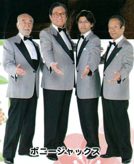
ポニージャックス